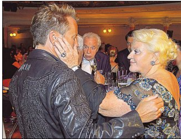
▲ Marika Lichter als Mutter Oberin neben Angelika Nidetzky & Ruth Brauer-Kvam und mit Uwe Kröger bei der ◀ Versöhnung.